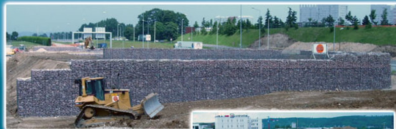
Voie rapide III à Grand Quevilly Routière Perez