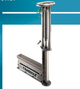
Agrafeuse pneumatique ou manuelle pour une pose plus rapide de vos tapis

Protection maximale pour le contrôle de l'érosion et la stabilisation des sols