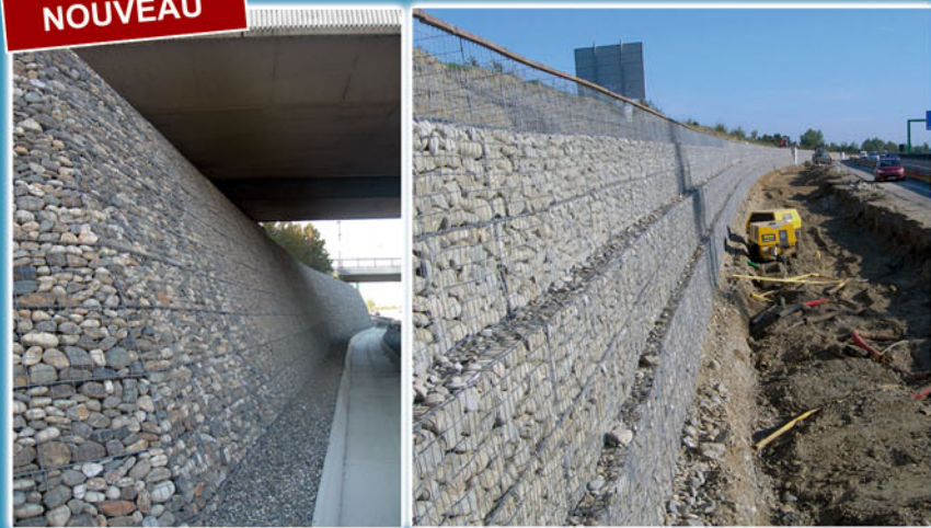
Rocade Est de Toulouse, 2 kms de gabions. Groupement Guintoli et Malet